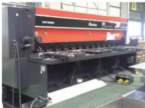
10尺マイクロシャー(アマダ製)

■ 加工品種材：冷延鋼板 / 熱延(酸洗)鋼板 / 表面処理鋼板 / カラー鋼板