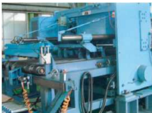
スケヤシャー(中板・厚板用 相澤鉄工所製)