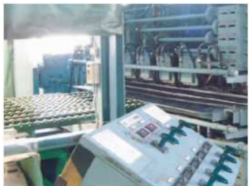
入側No1レベラー ワークロール上下計21本設置(φ50mm)

■ 加工能力： 板厚 0.35～2.3mm 加工長 Max 3,500mm Min 400mm 積載重量 Max 3,000mm レベラーロール 2基設定