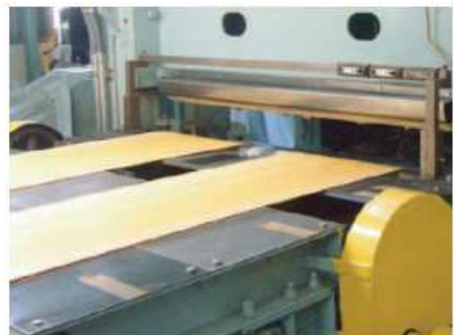
レベラーシャー(アップカット方式)

■ 使用コイル(母材) 重量 Max 15,000kg 母材幅 600～1,350mm 外形 Max φ1,900mm 内径 φ508mm, φ610mm